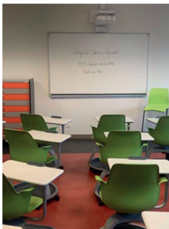
Salle du Futur

Les locaux sont adaptés aux enseignements professionnels.